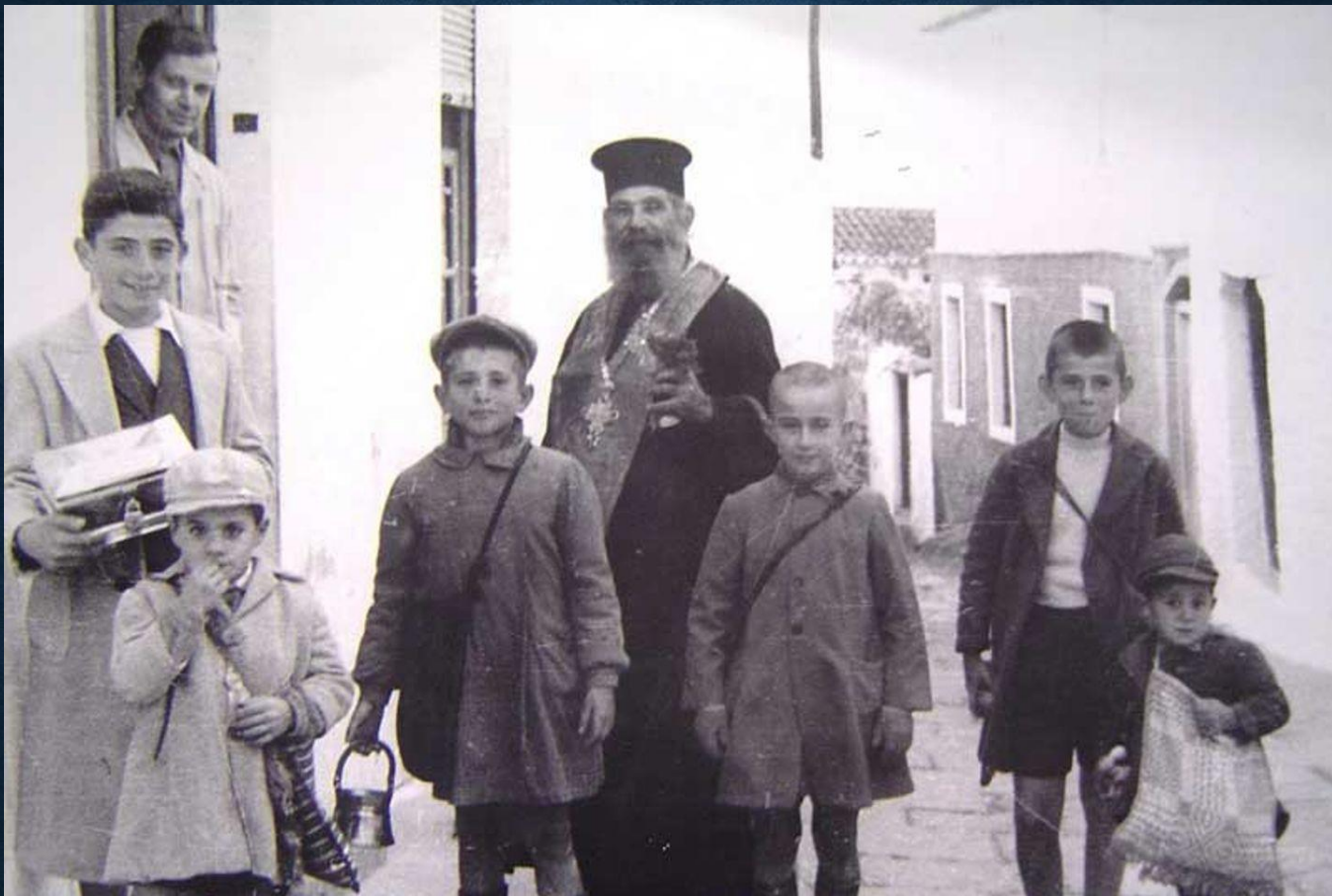
Εικόνα: Αένη επ'Ανάσταση: Θεοφάνεια: Αρβανίτικα έθιμα και κάλαντα των Φώτων

Ο ιερέας, μετά το τέλος της λειτουργίας, γυρίζει όλα τα σπίτια για να «καλαντίσει», να ραντίσει δηλαδή με αγιασμό και να διώξει κάθε κακό. Τον ιερέα συνοδεύουν μικρά παιδιά για να τον βοηθήσουν. Κρατούν το σιδερένιο κουβά με τον αγιασμό και φανάρι αναμμένο από το καντήλι του Χριστού. Με αυτό οι γυναίκες θα ανάψουν το καντήλι του σπιτιού τους. Με το καλάντισμα οι άνθρωποι πίστευαν ότι ο ιερέας θα έδιωχνε τους καλικάντζαρους, τα κακά πνεύματα δηλαδή. Στον ιερέα που καλάντιζε πρόσφεραν ξεροτήρινα (λουκουμάδες), λουκάνικα ή ξηρούς καρπούς (καρύδια, αμύγδαλα) και νομίσματα.